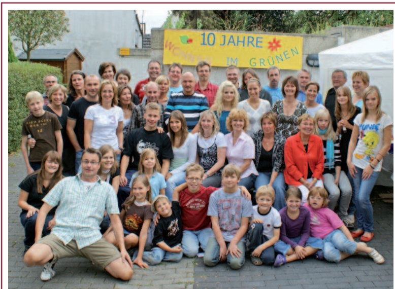
Vor zehn Jahren wurde die GWG-Häuser Strangstraße und Franz-Cloid-Weg bezogen. In dieser Zeit hat sich eine großartige Nachbarschaft entwickelt. Zum zehnjährigen Jubiläum wurde ein tolles Fest veranstaltet. Die GWG unterstützte das Fest mit einem finanziellen Beitrag.