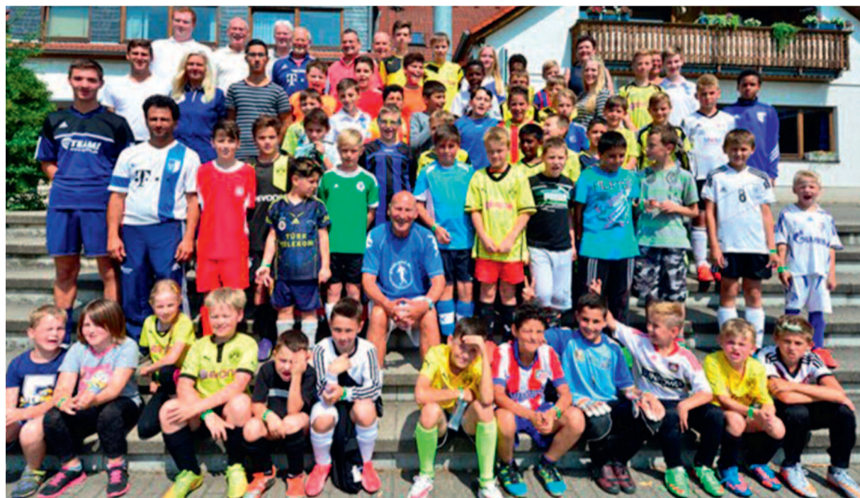
Über 50 GWG-Mieterkinder hatten sich für die Fußballschule am Schützenhof angemeldet. Der frühere Bundesligaspieler Wolfgang Kleff hatte jede Menge Profi-Tipps parat. Das Fußball verbindet, konnten alle auf und rund um den Sportplatz erleben, die Stimmung war bei allen Generationen und Nationen hervorragend.

gesorgt und auch Essen bereitgestellt. Am Samstag mündete die Fußballschule in ein gemeinsames Grillen mit den Eltern – und einer Tombola, die es in sich hatte. So gab es Trikots von Marc-André Terstegen, Marco Reus oder Pierre-Emerick Aubameyang, einen handsignierten Ball mit Weltmeister-Unterschriften von Horst Eckel, Wolfgang Overath, Wolfgang Kleff und Hans-Peter Briegel, der Walz aus der Pfalz sowie viele andere Dinge.