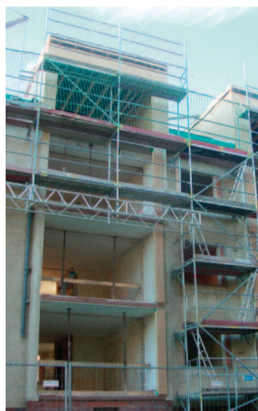
Mit dem Bau der neuen Wohnungen Am Bruch wurde begonnen.

zurück in ihre Wohnungen ziehen. Interessenten für die barrierefreien Wohnungen Am Bruch 13 a und b können sich bei der GWG jetzt eintragen lassen, E-Mail an info@gwg-schwerte.de .