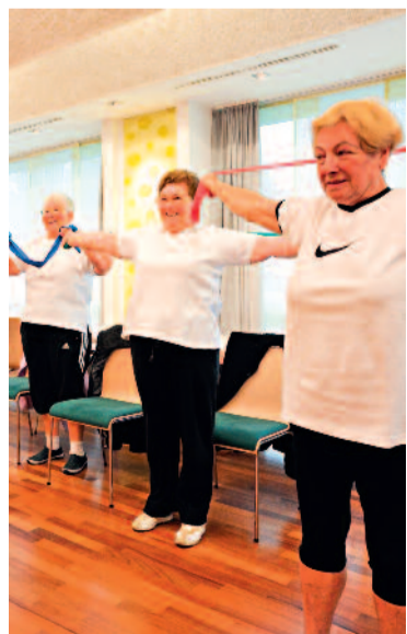
Der GWG-Gemeinschaftsraum an der Schützenstraße ist vielseitig nutzbar.

Die Dramatik der Flüchtlingsituation in Schwerte beschäftigt natürlich auch die Verantwortlichen der Gemeinnützigen Wohnungsbaugenossenschaft Schwerte eG (GWG) seit geraumer Zeit. Weiterhin kommen jeden Monat viele Menschen auch in Schwerte