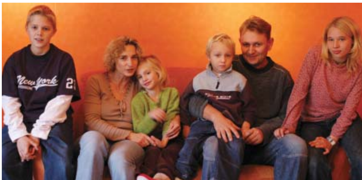
Endlich Platz für die ganze Familie, jetzt haben alle vier Kinder ein eigenes Zimmer.