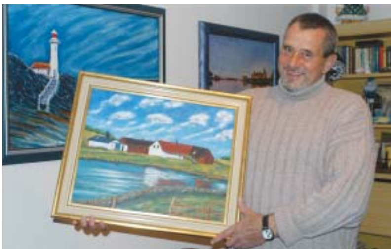
Die Wohnung ist eine Galerie mit Bildern von Klaus Brinkmann.