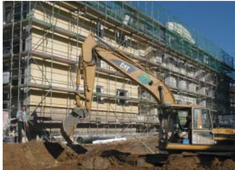
Vor dem Haus Virchowstraße 6 a-c entsteht eine Tiefgarage für 24 Fahrzeuge. Damit wird die schwierige Parksituation deutlich verbessert. Auf der Garage werden Mietergärten angelegt.