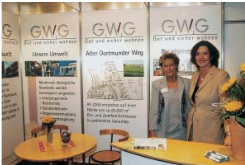
Über 90 Schwerter Unternehmen präsentierten am 9. Oktober ihre Leistungskraft im Technopark Lohbachstraße. Davon konnte sich auch NRW-Wirtschaftsminister Harald Schartau überzeugen, der dieser Messe einen Besuch abstattete. Ziel der Organisatoren war es, eine verbesserte Kommunikation zwischen den Unternehmen herzustellen. Die GWG Schwerte war natürlich auch mit einem repräsentativen Messestand vertreten. Als leistungsstarkes Schwerter Unternehmen konnten wir unsere vielfältigen Aktivitäten im Neubau- und Modernisierungsbereich darstellen. Auf der Messe wurde auch erstmals die GWG-Planung für das Neubaugebiet Alter-Dortmunder-Weg vorgestellt.