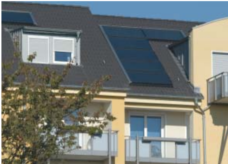
Mit einem Neubau zu verwechseln sind die „rundumerneuten“ Häuser an der Virchowstraße. Dachgeschoßwohnungen, neue Fenster, Balkone, Solarkollektoren und die neu verputzte Fassade kennzeichnen das Bild.

ten vermieden werden. Das ist vor allem auch der Kooperationsbereitschaft der Mieter zu verdanken und deren Bereitschaft, auch Beeinträchtigungen während der Bauzeit zu akzeptieren. Die GWG investiert hier 17 Mio. Euro.