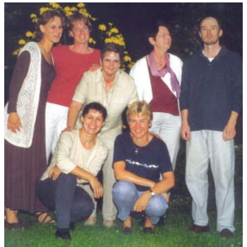
Das Betreuungsteam des Schwerter Hospizes.