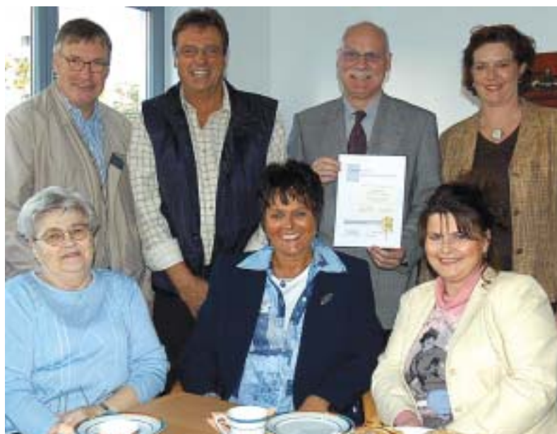
Bei Kaffee und Kuchen wurden die Preise an die Gewinner(innen) im Gemeinschaftsraum am Hermann-Löns-Weg überreicht.

gelohnt: „Solche Aktionen, aber auch unsere Nachbarschaftsfeste, fördern die Kommunikation in unserer Genossenschaft. Durch den Balkon-Wettbewerb haben wir eine engagierte Mieterin gewinnen können, die mittlerweile für unsere älteren Mieter im Wohngebiet Am Lenningskamp/Holzener Weg ehrenamtlich ein Veranstaltungsprogramm auf die Beine gestellt hat, das rege angenommen wird.“ Der Balkon-Wettbewerb soll auch 2005 wieder stattfinden.