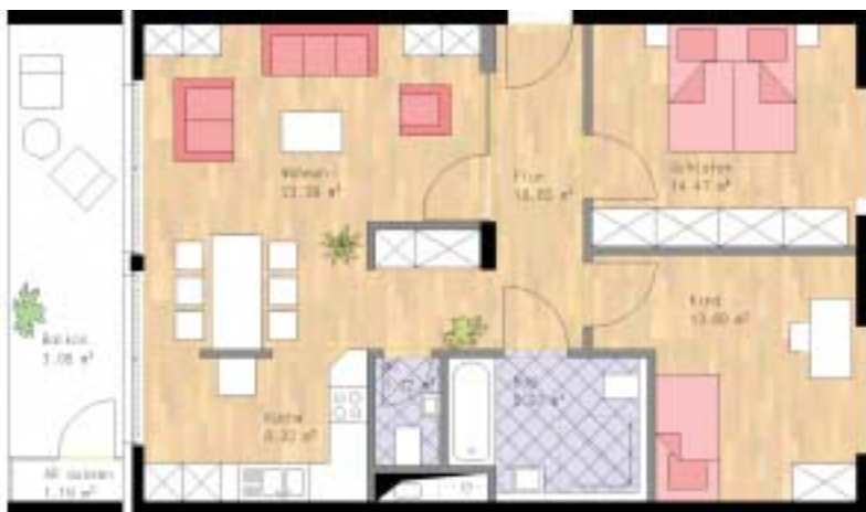
Dieses Beispiel zeigt eine 3½-Zimmer-Wohnung. Der Grundriss ist variabel und kann nach den Wünschen der Bewohner(innen) verändert werden. So ist zum Beispiel eine offene oder eine geschlossene Küche – ganz nach Wunsch – möglich.

Zurzeit finden die Auftragsvergaben an die Rohbauunternehmen und die Handwerksbetriebe statt. Die Gesamtkosten hierfür werden rd. 6,0 Millionen Euro betragen. Die öffentlichen Mittel des Landes NRW in Höhe von 2,3 Millionen Euro sind hierfür bereits vor Monaten bewilligt worden. Auch bei diesem Objekt beteiligt sich die GWG mit einem hohen Eigenkapitaleinsatz.