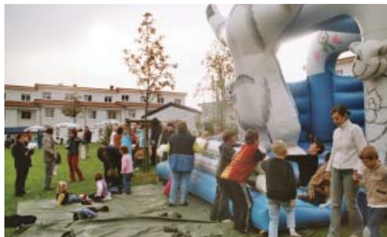
Die Hüpfburg war von den Kindern immer belagert.