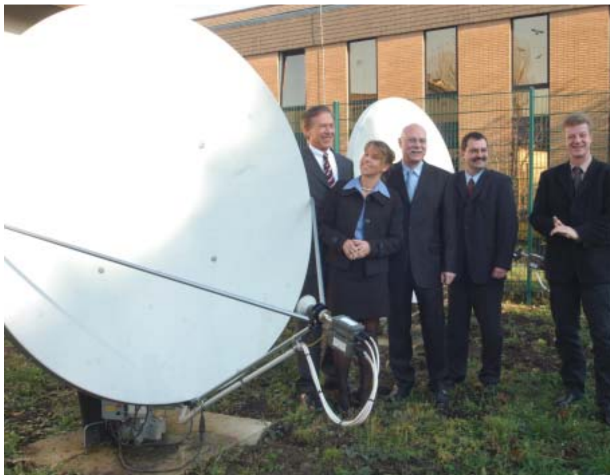
Die Satelliten-Empfangsstation befindet sich neben dem SWS-Verwaltungsgebäude an der Liethstraße. Von hier aus werden die Fernsehsignale in das Kabelnetz geleitet.