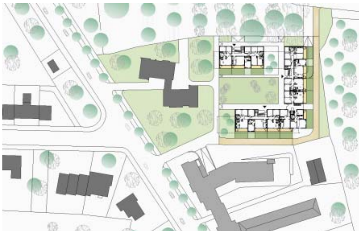
Ausschnitt aus dem Lageplan mit dem skizzierten Neubau Schützenstraße 24 und 26.