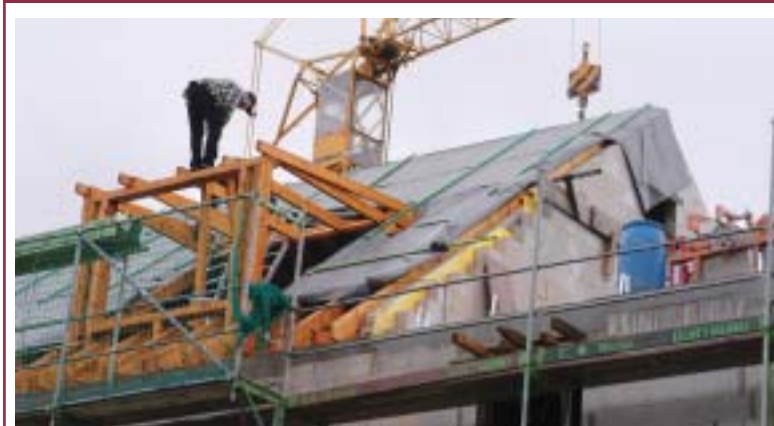
Halbzeit bei der Modernisierungsmaßnahme im Wohngebiet Virchow-, Regenbogen-, Kopernikus- und Nettelbeckstraße. Zurzeit wird mit Hochdruck am Um- und Ausbau der Kopernikusstraße 12 – 18 gearbeitet. Unter dem ausgebauten Dach entstehen zusätzliche Wohnungen, zum Teil über zwei Ebenen mit Galerie (Foto unten).