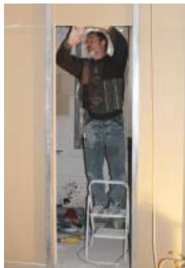
Modernisierungen prägten 2004 die Arbeit der Genossenschaft.

Es war turbulent, arbeitsintensiv, erfolgreich und wir sind mit unserem großen Modernisierungsprogramm ein gutes Stück voran gekommen.