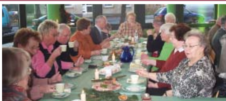
Für unsere GWG-Senioren vom Lenningskamp/Holzener Weg, Am Zimmermanns Wäldchen und Sauerlandstraße fand im neuen Gemeinschaftsraum am Holzener Weg eine Weihnachtsfeier statt. Über 50 kamen und verbrachten einen gemütlichen Nachmittag.