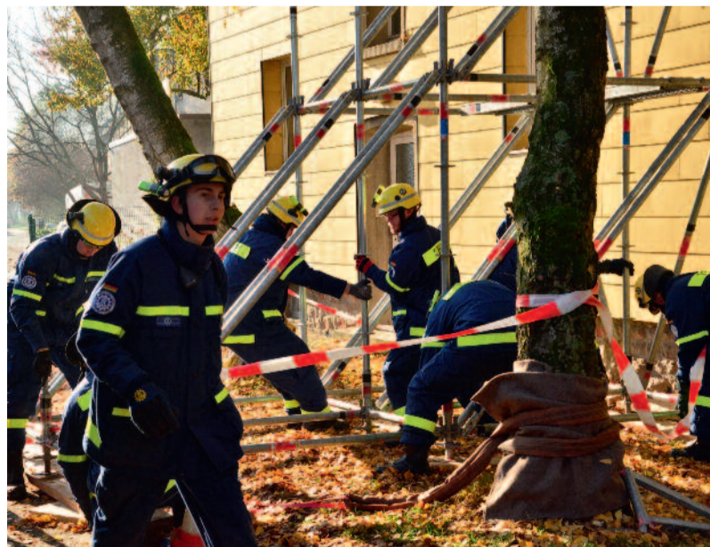
THW-Übung an den leerstehenden GWG-Häusern an der Lohbachstraße.

Nach Abschluss der Übung waren Einsatzleiter und Rettungskräfte sehr zufrieden. Alle gerettet, alles hat reibungslos geklappt.