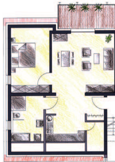
Die Gebäude werden aufgestockt und bekommen im neuen Dachgeschoß helle und großzügige Wohnungen mit Balkon im Dacheinschnitt. Das Bild zeigt den Grundriss einer Wohnung.

nungen entstehen. Mittels neu eingebauter Aufzüge werden alle Wohnungen barrierefrei erreichbar sein, was sicherlich nicht nur für