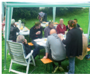
Am Grafeneck wurde gefeiert.

Gleich mehrere Nachbarschaftstreffen haben GWG-Mieter in den letzten Wochen in Eigenregie organisiert. Eine schöne Sache, die die Genossenschaft auch immer