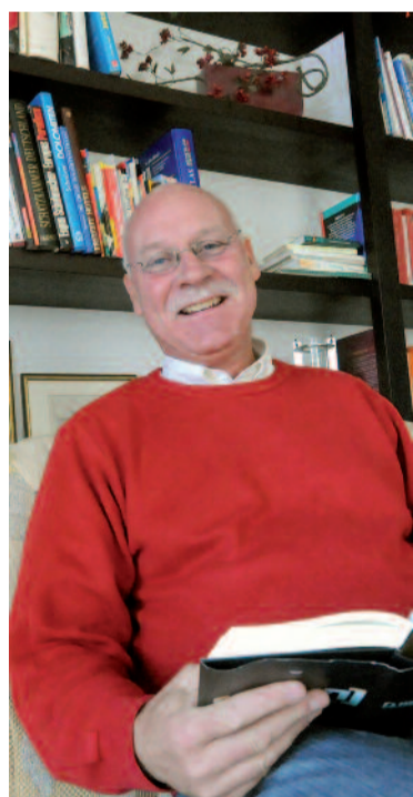
Mehr Zeit zum Lesen...