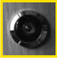
Türspion – besser noch: