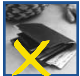
Falsch: Geldbeutel beim Bezahlen aus der Hand legen.