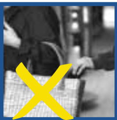
Falsch: Taschen nicht offen tragen.