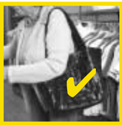
Richtig: Tasche dicht am Körper tragen.

Diese Masche ist besonders gemein: Durchweg deutsche Einzelgänger beobachten Sie beim Einkaufen und bieten Ihnen scheinbar hilfsbereit noch im Geschäft oder auf der Straße an, den Einkauf nach Hause zu tragen. Dort eilen sie mit der Tasche zügig die Treppe hinauf, während Sie als älterer Mensch nicht so schnell hinterherkommen. Unterwegs nehmen die Täter die Geldbörse heraus, stellen Ihre Tasche vor die Tür und kommen Ihnen dann womöglich noch mit einem freundlichen Abschiedswort entgegen. Den Verlust bemerken Sie erst beim Auspacken.