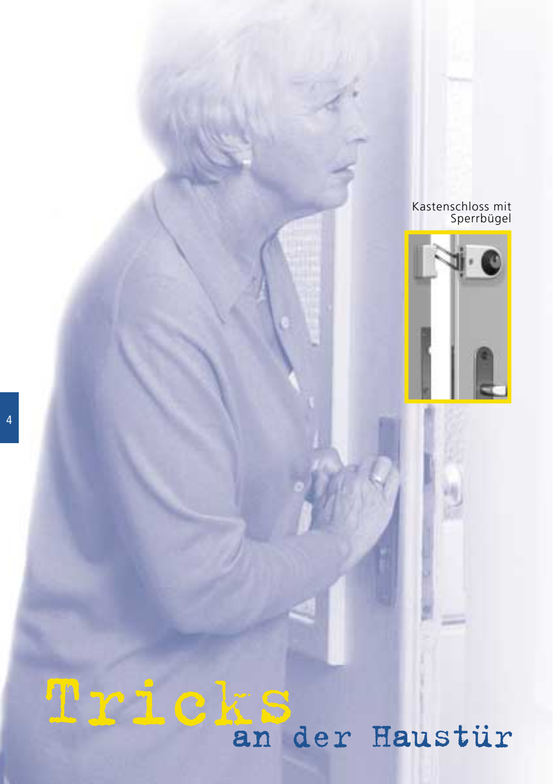
Kastenschloss mit Sperrbügel