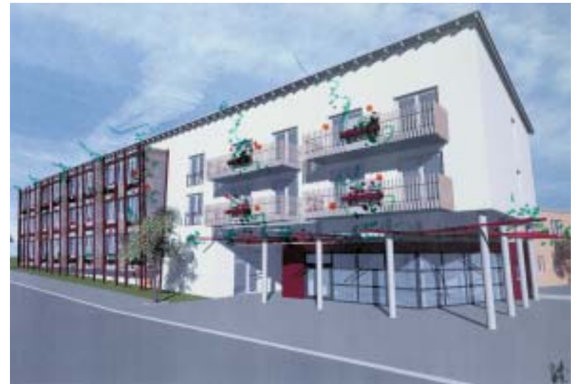
Entwurf einer möglichen Fassadengestaltung unseres Neubaus Service Wohnen Holzener Weg 28 und 30. Unten rechts die großzügige Glasfassade des zukünftigen Gemeinschaftsraums für das gesamte Wohngebiet.