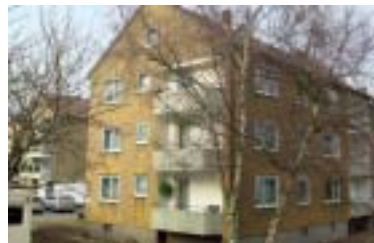
Virchowstraße 4 a - c

Im März fällt der Startschuss für die Fortsetzung der Modernisierungs- und Sanierungsarbeiten in der Virchowstraße. Nach dem die Häuser Virchowstraße 2 a - c fast fertiggestellt sind, geht es nun weiter mit Virchowstraße 4 a - c. Mit einem Investitionsvolumen von ca. 1,6 Mio. Euro werden die Häuser energetisch auf den neuesten Stand gebracht. Mit der Wärmedämmung des Gebäudes, einer neuer energieeffizienten Heizungsanlage, neuen Fenstern und der Nutzung der unerschöpflichen Energie der Sonne und des Regenwassers verbinden wir das Ziel, der ständigen Kostensteigerung bei den Energie- und Wasserkosten entgegenzuwirken. Bereits heute können wir feststellen, gerade nach den letzten, sehr