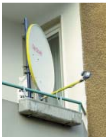
Solche unschönen Satelliten-Antennen werden durch die neue Technik überflüssig.

Strom, Gas, Wasser, Müllabfuhr – die Nebenkosten verteuern das Wohnen