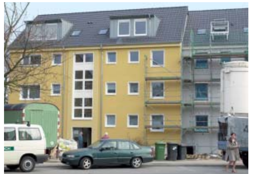
Kaum wieder zu erkennen: Virchowstraße 2c – nun ein modernes Wohnhaus mit allem Komfort.