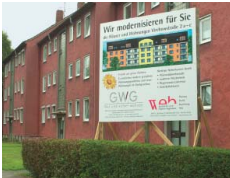
Am 19. August beginnen die Bauarbeiten an der Virchowstraße 2 a-c.

der Bäder und Küchen, der Schaf- fung von modernen Wohnungs- grundrissen sowie dem Ausbau der Dachgeschosse in großzügige z. T. Maisonette-Wohnungen zu- sammen mit den energieeinspa- renden Maßnahmen können wir unseren Mitgliedern hochwertigen Wohnraum zur Verfügung stellen.