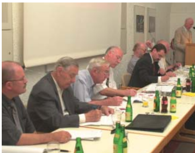
Vorstand und Aufsichtsrat während der Generalversammlung.