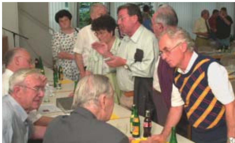
Zeit für individuelle Gespräche nach dem offiziellen Teil.