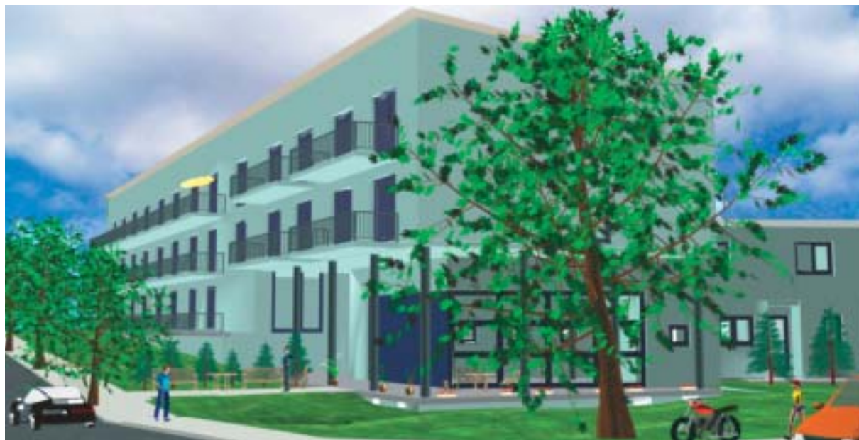
Die Planung des Hauses Holzener Weg 28–30 in dem wir ein weiteres Projekt mit Betreutem Wohnen anbieten, vorn am Gebäude ist der Gemeinschaftsraum zu erkennen.

über die Mietwohnungen anfordern und sich vormerken lassen. Anja Wichtowski steht Ihnen unter ☎ (02304) 24032-18 oder per E-Mail unter wichtowski@gwg-schwerte.de zur Verfügung.