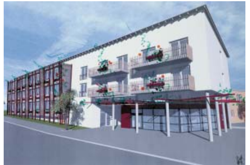
Entwurf einer möglichen Fassadengestaltung unseres Neubaus Service Wohnen Holzener Weg 28 und 30. Unten rechts die großzügige Glasfassade des zukünftigen Gemeinschaftsraums für das gesamte Wohngebiet.